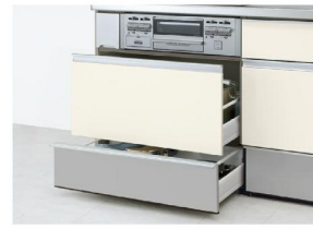
※2口コンログリルなし用タイプも ご用意しています。 スライドストッカー (ポケットなし)