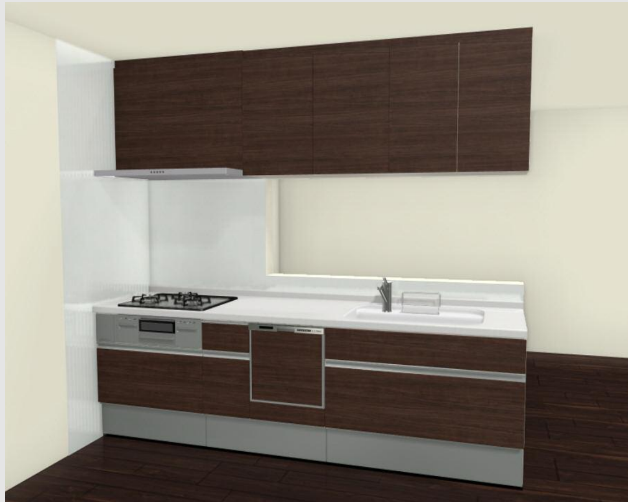
CG合成によるイメージ画像です。 現場調達品、シリーズ外選定品に関しては表現しておりません。