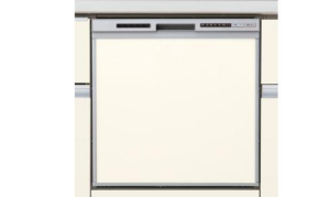
浅型タイプ(パネル材仕様) NP45RS7SJGK