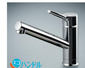
シングルレバー水栓 クロマーレス・エコハンドル SFWM420SYXJGK