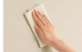
※長くお使いいただくために、やわ らかい布でお手入れしてください。