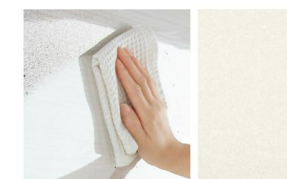
ラフサンドホワイト