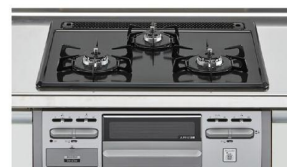
フェイス:シルバー トップ:グレー レンジフード連動なし 3口コンロ・ホーロートップタイプ (無水片面焼グリル) H1633A0RHVK132A