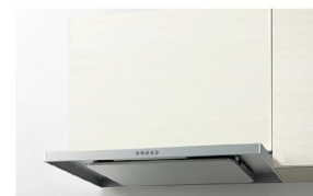
別売品:化粧パネル・金属扉板 ※写真は化粧パネルです。 シルバー 加熱機器連動なし ASRタイプ ASR931SIRK