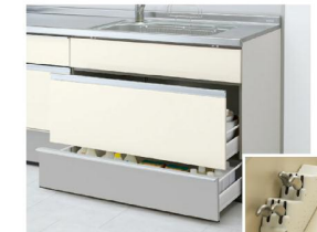
包丁差し スライドストッカー (ポケットなし)