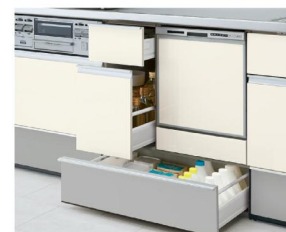
スライドストッカー 3段引出し 浅型用