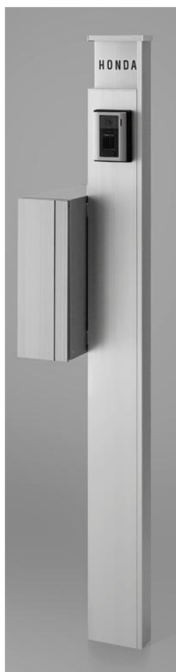
ナチュラルシルバーF