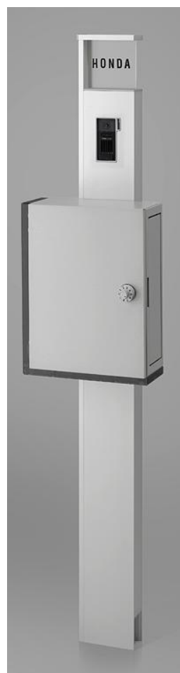
ナチュラルシルバーF