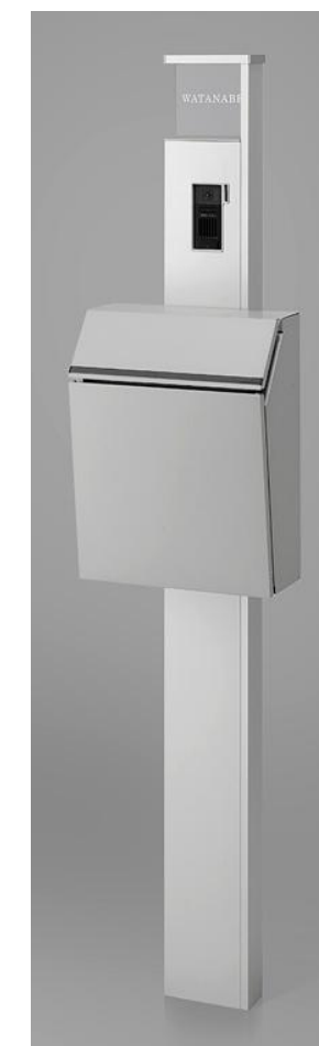
ナチュラルシルバーF