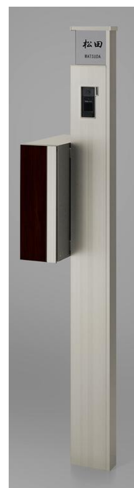
シャイングレー + クリエターク