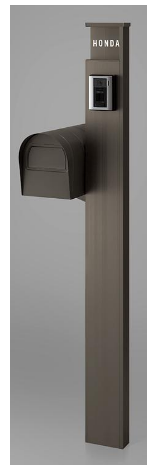
オータムブラウン